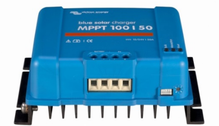
Solar Lade-Regler MPPT 100/50