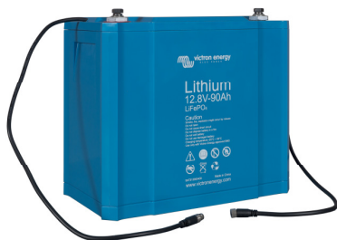
12,8 V 90 Ah LiFePO 4 Batterie

Unser 12 V BMS unterstützt bis zu 10 parallelgeschaltete Batterien (BTVs sind einfach ver-kettet).