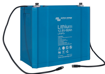
12,8 V 60 Ah LiFePO 4 Batterie