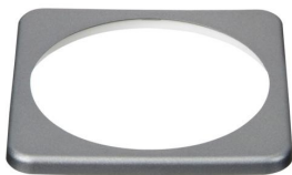
Quadratische Blende für den BMV